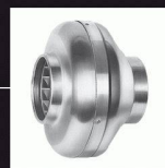
Ventilateurs pour gaines