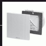
Système d'aération monogaine