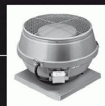
Ventilateurs de toits

30 Jahre Erfahrung Helios Ventilatoren AG Lufttechnik