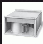
Ventilateurs centrifuges à action