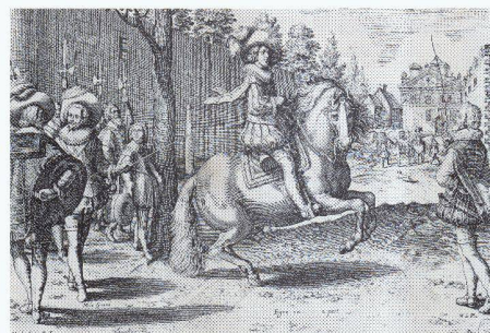
« Le Manège royal » gravure publiée par Plumet (1613) (Document) - Ch. Darroux

Le principe dialogique Francesco Della Casa