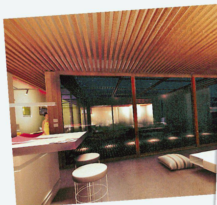
Vue plongeante sur le living depuis la cuisine.

Une maison, c'est l'aboutissement d'un rêve. Spécialiste suisse de la construction, notre groupe est là pour lui donner vie. Bois, parquets, carrelages, matériaux, salles de bains, cuisines, appareils ménagers et aménagements extérieurs, l'habitat est notre métier. Et une passion que nous exerçons depuis plus de 150 ans, toujours à l'affût des nouvelles tendances. Car la tradition n'empêche pas l'innovation. N'hésitez pas à nous confier vos projets, nous en ferons une belle maison. Rendez-vous dans nos expos.