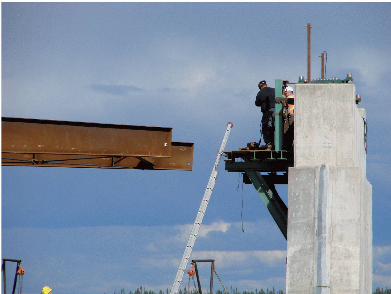
Fig.11 : Ajustement de la hauteur d'un appui