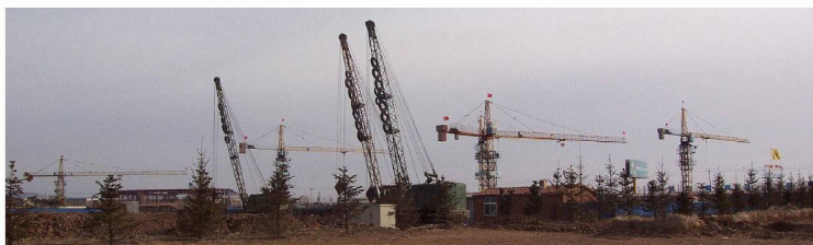
Grues en Chine