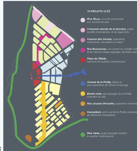
Fig. 1 : Périmètre du masterplan, avec le tracé de la liaison ferroviaire CEVA