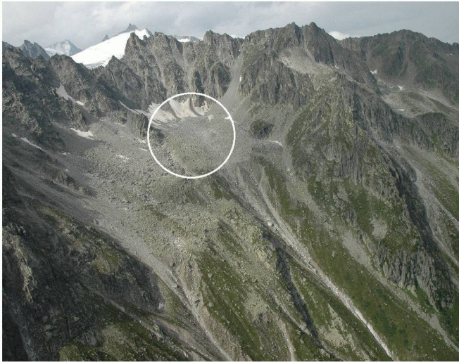
Fig. 7 : Eboulement de Randa en 1991 (Image revue « Les Alpes », Club alpin suisse) (Sauf mention, tous les documents illustrant cet article ont été fournis par le CREALP.)