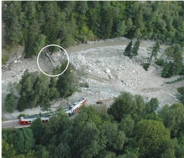
Fig. 4: Confluence des Jures du Durnand en provenance des Liapays de Grône