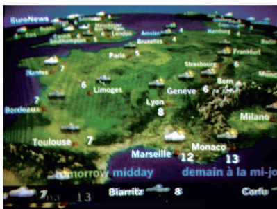
La météo sur EuroNews