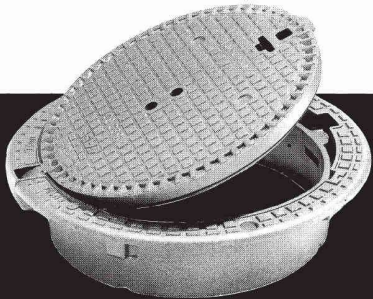
Classe D400, E600 et F900

avec ou sans verrouillage (ventilé ou non en D400 ).