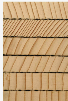
Contreplaqué avec des liaisons soudées.