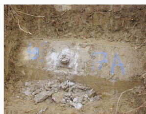
Tête d'ancrage délogée

Réaction alcali-granulats Pascal Kronenberg et Christine Merz