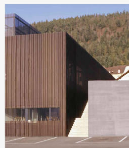
Centre commercial à Genève. Geninca-Dellefontaine architectes, Neuchâtel

Éléments du collectif Francesco Della Casa