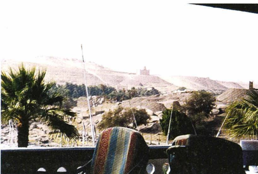
Vue sur le mausolée de l'Aga Khan, depuis la terrasse du Palace Hôtel « Old Cataract »