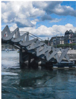
Passerelle du Jet d'eau et quai Gustave-Ador, Genève