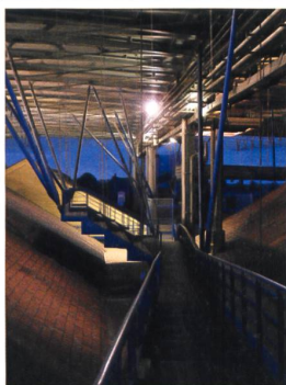
L'espace praticable entre l'ancien et le nouveau toit du Fresnoy.