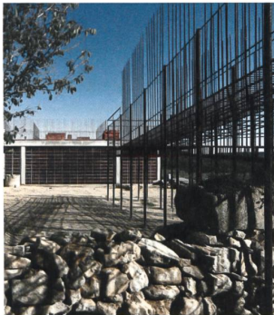
Centre d'interprétation du dolmen mégalithique de Seró, Lleida. Toni Gironés, 2012.