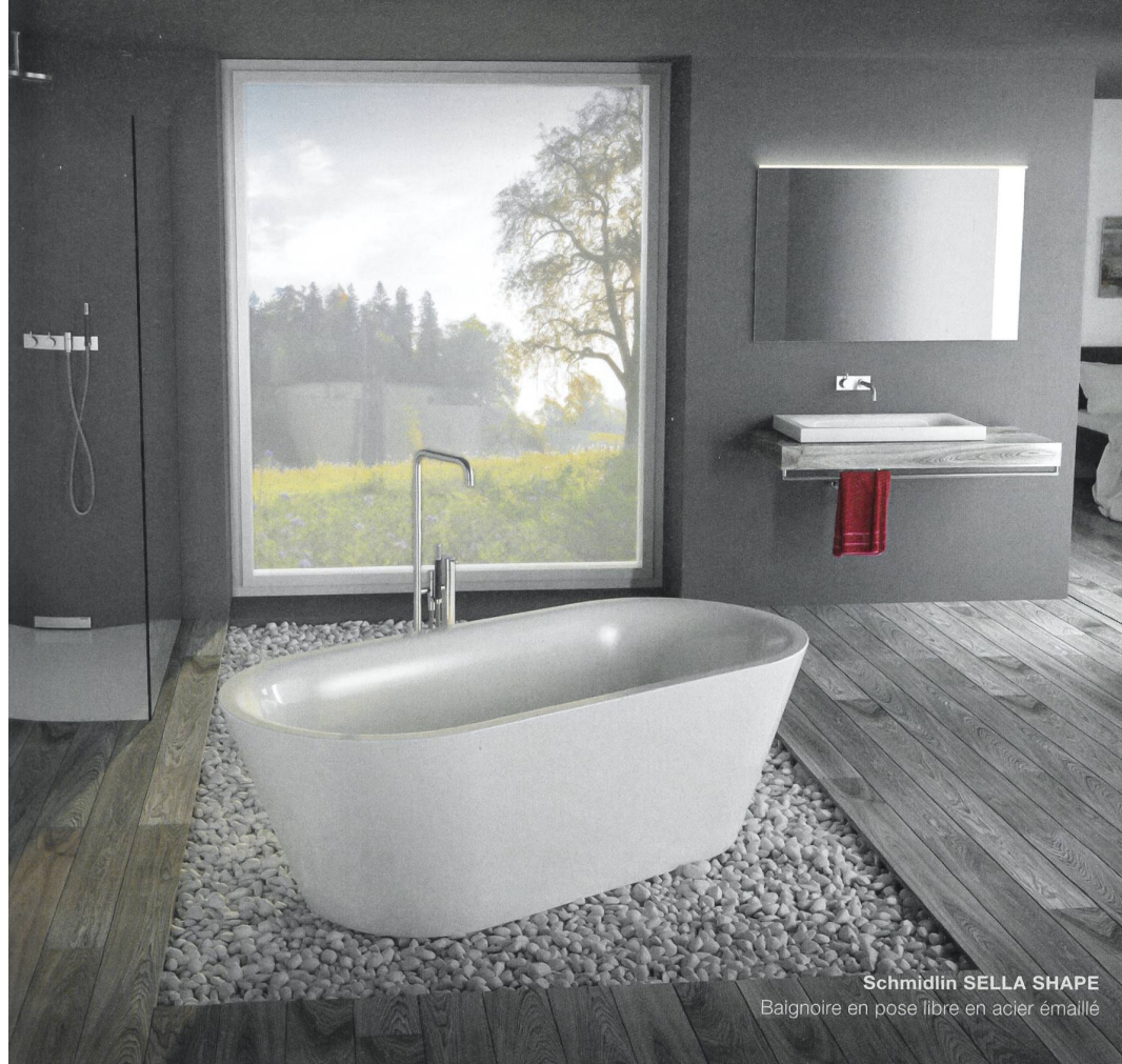
Schmidlin SELLA SHAPE Baignoire en pose libre en acier émaillé