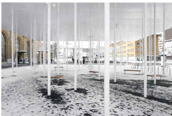
La nouvelle place de la Gare de La Chaux-de-Fonds