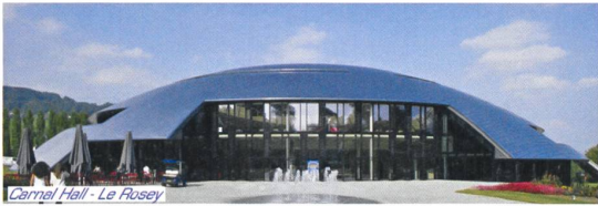
Carnal Hall - Le Rosey

Ch. l.-de Montolieu 161 - 1010 Lausanne Tél. 021 601 44 59