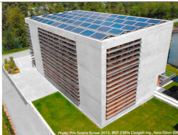
Photo: Prix Solaire Suisse 2015, BEP 238% Cavigelli Ing., Illanz/Glion (GR)