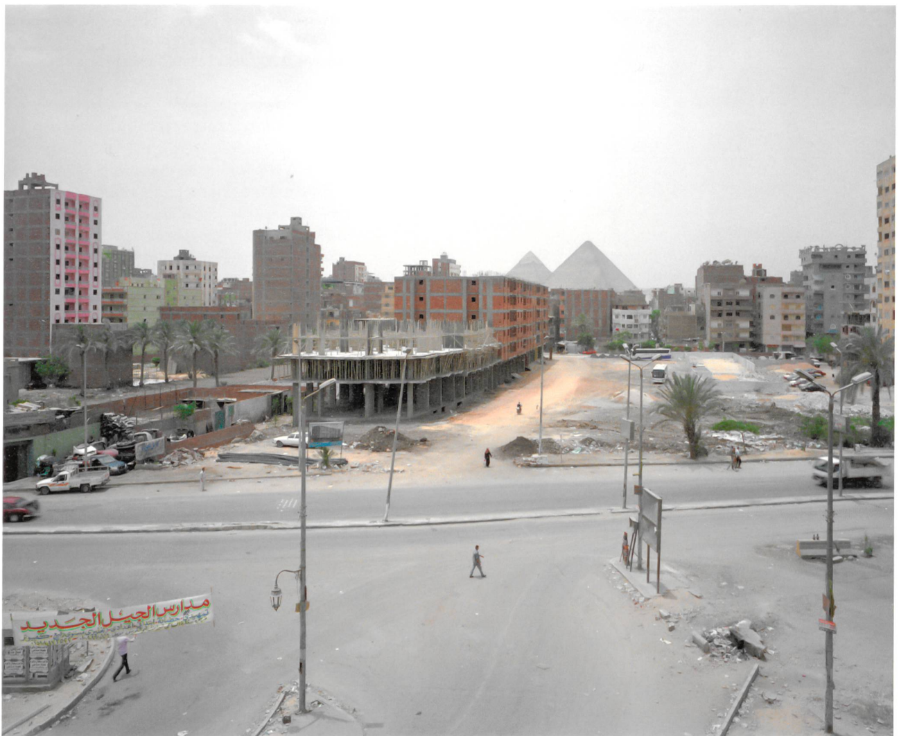
Cairo Ring Road Egypte, 2015 / Anthony Hamboussi

Surplus! Logements de la périphérie présente une sélection de photographies de Cairo Ring Road , un projet plus large sur le paysage urbain et architectural du Caire. Ces photographies, prises en périphérie de la ville, dépeignent l'ampleur et l'excès de la construction d'immeubles résidentiels, la forte densité et les vues dystopiques souvent désertes de logements du Caire contemporain. Des millions de mètres carrés de biens immobiliers inoccupés encerclent la banlieue du Caire. Le boom résidentiel de la dernière décennie a produit une surabondance de logements excessivement chers et pauvrement construits qui sont hors de portée géographiquement et économiquement pour la majorité des Caireotes. Le boom immobilier a également existé pour le secteur informel de la construction qui a approvisionné le marché de quartiers informels où habitent deux tiers des habitants de la ville.