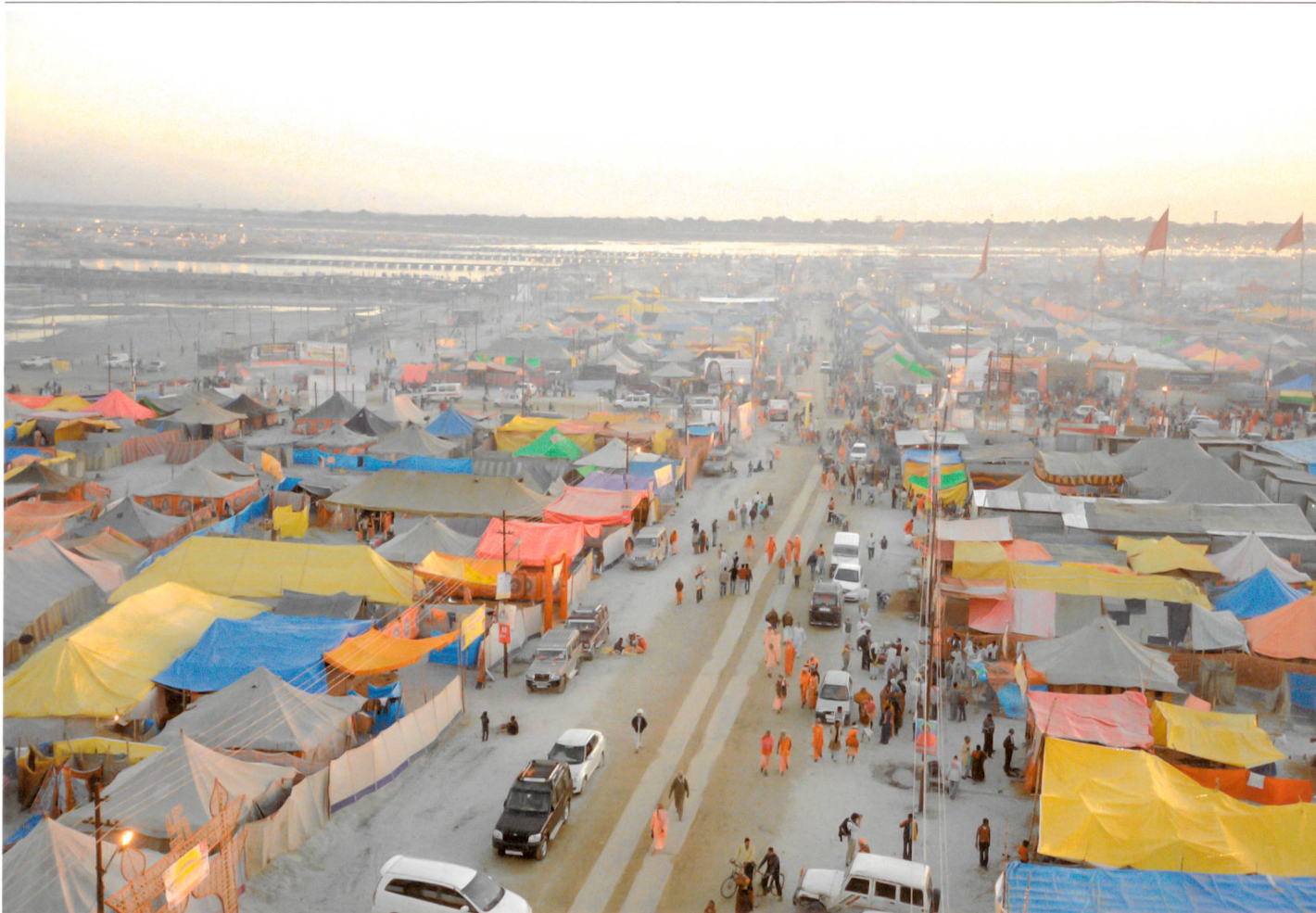
Mapping Kumbh Mela, 2013, Inde, Rahul Mehrotra et Felipe Vera Benitez, architectes

Une exposition avec des ambitions de biennale sur les manières d'habiter le monde, prévue cet été à Bordeaux.