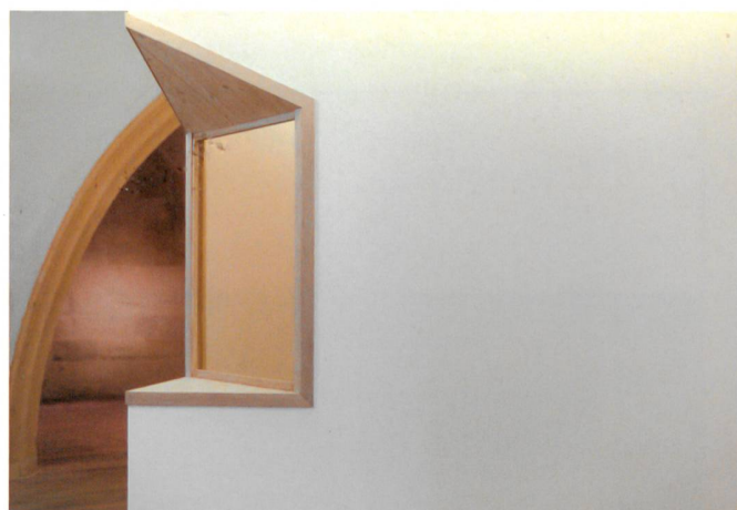
Les combles de la chapelle aménagés en salles de classe