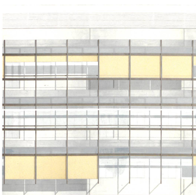
Image de la nouvelle façade de l'Amphipôle (© Aeby Pernegger & Associés)