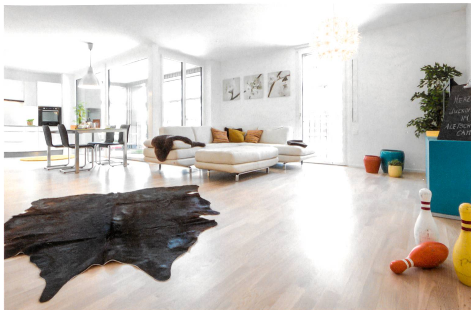
199 systèmes d'aération multilocal Ego®Fresh dans l'objet de référence MINERGIE® Aletsch Campus, Naters.

La tendance va vers les systèmes d'aération intelligents; dans ce contexte, les appareils d'aération décentralisés pour chaque pièce deviennent de plus en plus intéressants, pour plusieurs raisons. D'une part, une aération décentralisée telle Ego®Fresh est plus économique qu'un système centralisé en raison de la conception plus simple et du coût d'installation plus intéressant. D'autre part, Ego®Fresh est aussi très bien adapté aux réhabilitations.