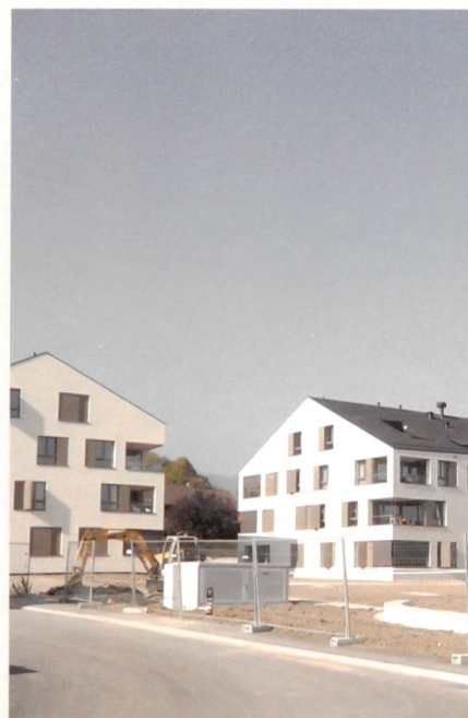
Fig. 3: Cinq immeubles de logements à Borex (VD)

dernier. Des termes comme habitat frugal ou habitat sain ont fait leur apparition (fig. 1). C'est là une tendance architecturale qui se veut plus proche de la nature, plus en phase avec son contexte aussi. Forme, organisation, matières tendent de plus en plus vers une refonte de la relation que nous avons au « naturel ». Plusieurs projets présentés durant les Journées SIA proposent d'explorer les couples nature-culture ou naturel-artificiel.