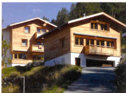
Fig. 1: Maisons Lundström, deux maisons Minergie-P-ECO à Nax (VS)