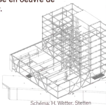
Schéma: H. Wetter, Stetten

Antenne romande du Centre suisse de la construction métallique SZS