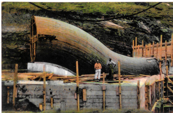
Image de chantier du percement du canal de Panama