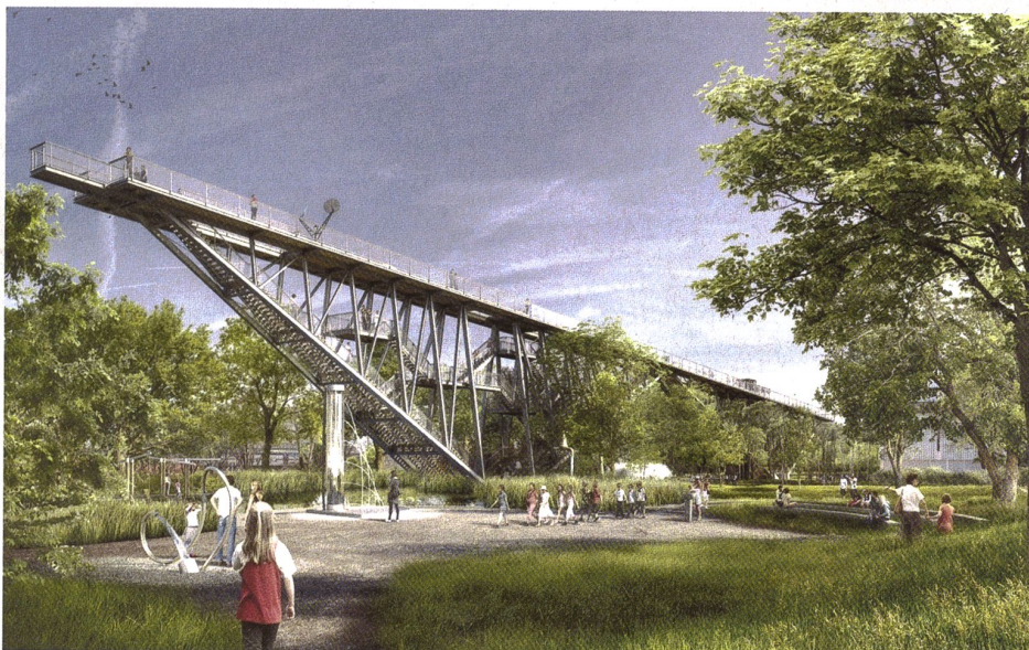
Vue panoramique sur le parc du Technorama: l'inauguration du «pont des merveilles» conçu par Conzett Bronzini Partner est prévue pour 2019.

d'ancrer son propos dans un lieu existant déjà bien fréquenté. D'où l'idée d'approcher le Swiss Science Center Technorama de Winterthour, qui comptabilise plus de 250 000 visites par an, dont 60 000 élèves.