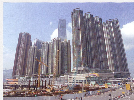
Chantier à Hong Kong

La Suisse était présente avec deux experts en énergie au forum annuel du Hong Kong Institute of Engineers (HKIE), qui s'est déroulé le 17 avril 2015 au Centre des expositions et des congrès de Hong Kong. Cette ville passe pour l'une des places économiques les plus libérales, les plus sûres et les plus attractives sur le plan financier. Cependant, ces avantages ont aussi leur revers. La mégapole et ses habitants ont depuis longtemps été rattrapés par les émissions liées au boom économique et par les problèmes de gestion des déchets et des eaux usées. Face à la part des bâtiments dans la consommation d'électricité, qui atteint 90 %, et aux nombreuses tours des années 1960-1980, il est urgent d'agir rapidement dans ce domaine aussi. Depuis les premières incitations économiques et mesures volontaires jusqu'au Building Efficiency Code, devenu depuis obli-