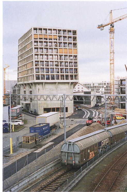
Helsinki Dreispitz (© Herzog & de Meuron, photo Katalin Deér)