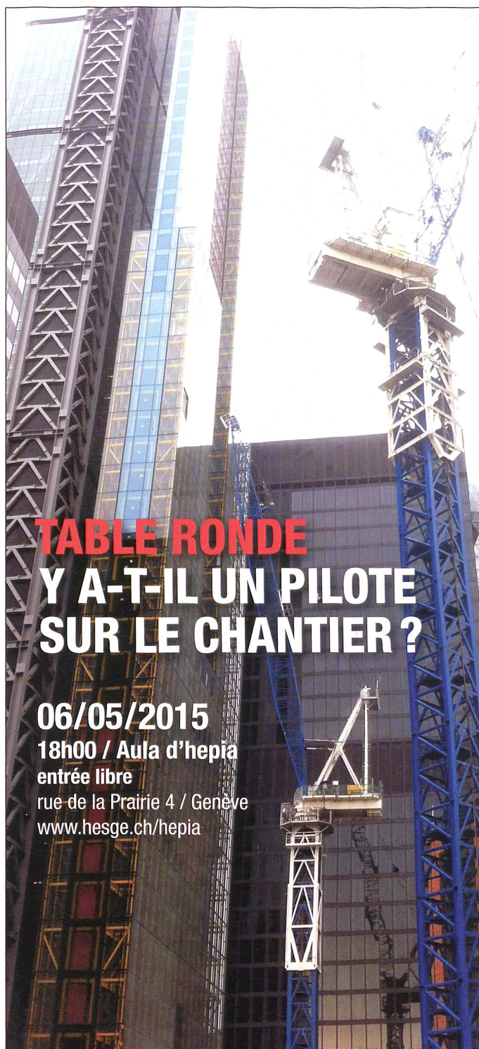
TABLE RONDE Y A-T-IL UN PILOTE SUR LE CHANTIER ?

Terre des hommes Aide à l'enfance. tdh.ch