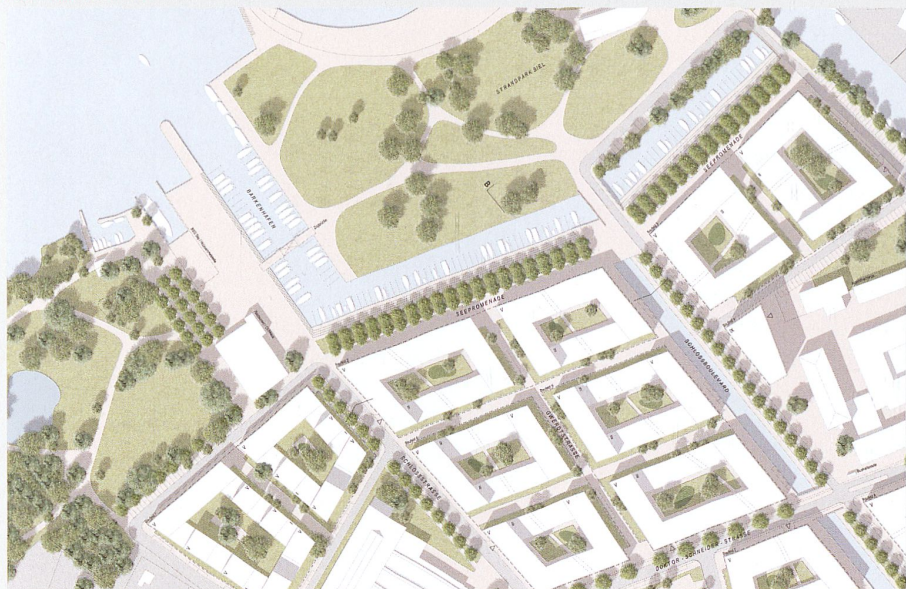
Fig. 2 © baukontor ag

dans le foyer de la Résidence Au Lac, à deux minutes de la gare de Bienne, que les discussions se sont nouées. Les espaces verts prévus sont-ils à l'échelle d'une population de près de 60 000 habitants? Rapproche-t-on la ville du lac en construisant des petits ensembles entre lesquels glisser des buissons et des bouts de prairie? Ou aurait-il été préférable d'ériger de vrais îlots urbains, de prolonger le port de plaisance et de créer ainsi une nouvelle promenade au bord de l'eau, comme l'a proposé l'équipe baukontor, autour de Vittorio Magnago Lampugnani (voir fig. 2)?