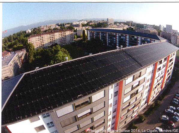
La Cigale, Genève/GE