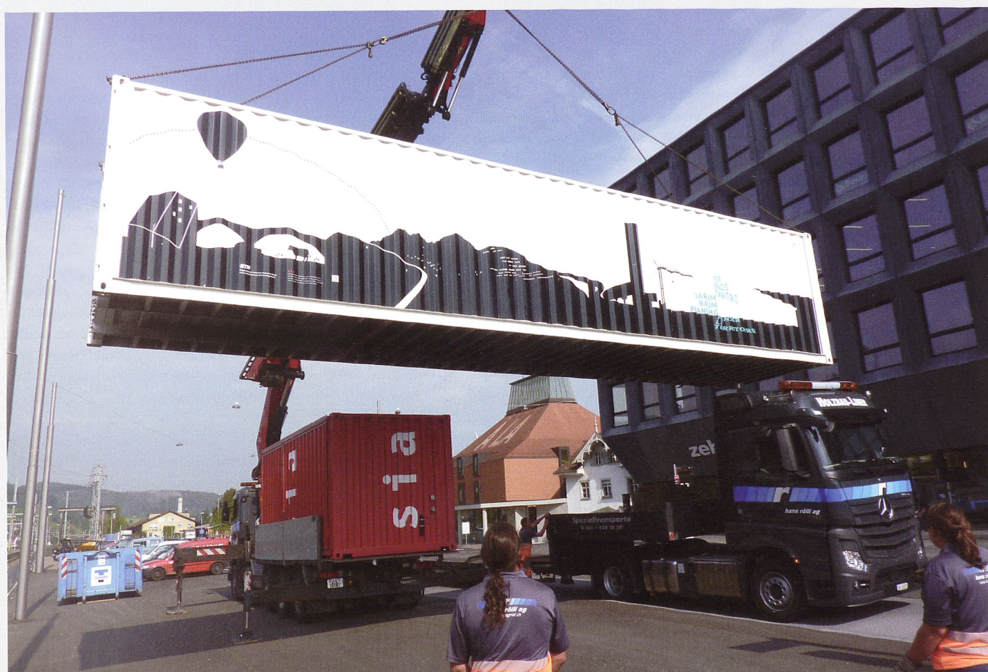
Peu avant la dépose : arrivée du conteneur d'exposition à Liestal, dans le canton de Bâle-Campagne

Pour tous les acteurs impliqués, ces expériences positives avec l'exposition itinérante sont un encouragement à instaurer, à l'avenir aussi, le dialogue avec les citoyens et les protagonistes régionaux grâce à des actions tout aussi vivantes, et à susciter en même temps le débat public dans la ville concernée. Responsable du projet Penser le territoire pour la SIA, Thomas Noack souligne que la loi révisée sur l'aménagement du territoire marque une césure pour l'économie du bâtiment, puisqu'elle est exclusivement