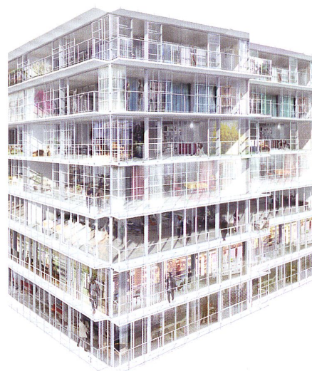
Projet SARA (Image Lacaton & Vassal architectes)