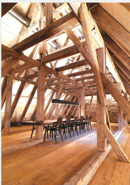
Le forum St. Katharinen à St-Gall, transformé par Klaiber Partnership AG Architekten, figurait parmi les nombreux objets originaux à visiter lors des Journées SIA 2014.