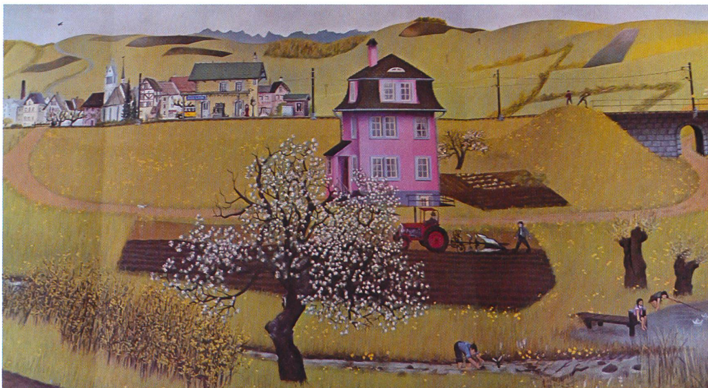
1, 2 La ronde annuelle des marteaux-piqueurs, ou la mutation d'un paysage, Jörg Müller (1974). Gullen petit village en 1953 (1), Gullen devenu une ville en 1972 (2)