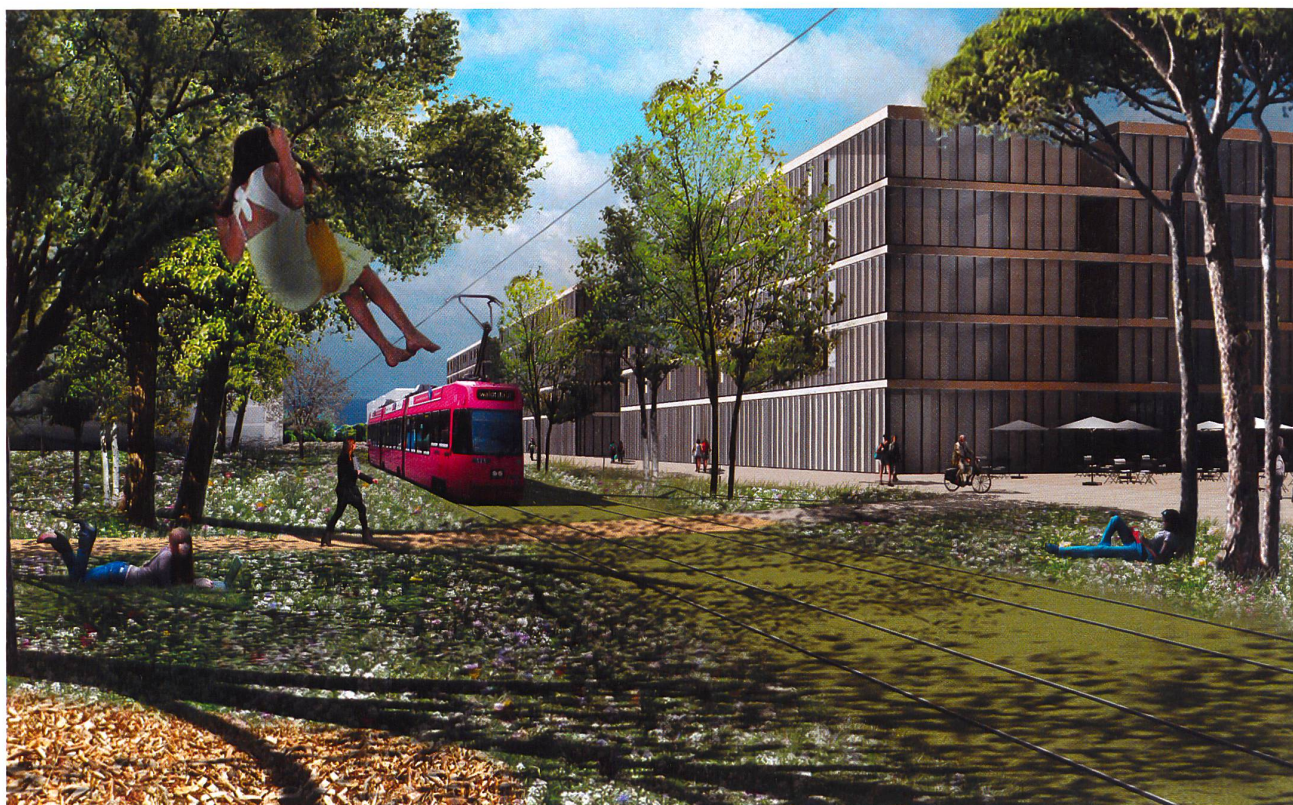
4 Visualisation d'une nouvelle polarité urbaine développée dans le cadre du projet interdisciplinaire Green Density (© LAST 2013)

La transformation des territoires métropolitains entre de surcroît en résonance avec une autre mutation sociétale, celle liée à la transition énergétique. La mise en œuvre d'une société à 2000 Watts, respectivement la décision de principe de sortir progressivement du nucléaire, implique en effet une réduction massive des besoins énergétiques et un recours largement prioritaire aux énergies renouvelables 11 . Dans ce contexte évolutif, les interactions entre les consommateurs et les producteurs seront de moins en moins centralisées. En termes de projet urbain, cela tendra à accroître les besoins de cohérence entre les stratégies spatiales et énergétiques.