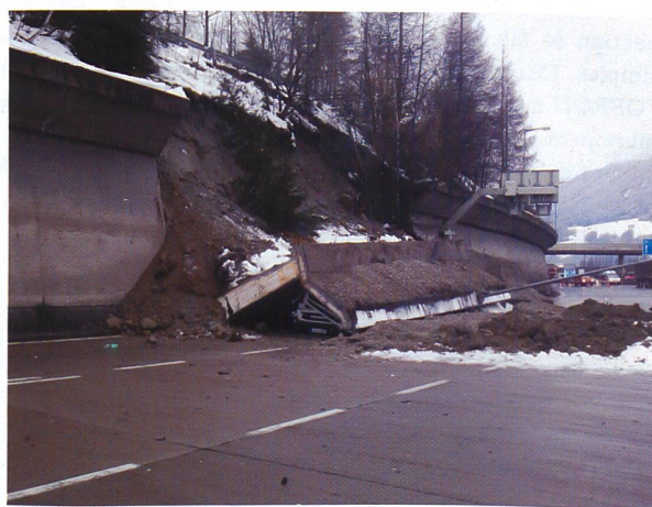
2 Effondrement du mur de soutènement Schönberg en Autriche, 20.03.2012 (Sauf mention, tous les documents illustrant cet article ont été fournis par les auteurs.)

Des rapports « Etudes et travaux 2006 – 2013 – rétrospective et expériences » et « Evaluation de l'état des murs de soutènement béton à semelles - Etude pilote - Rapport de synthèse des phases 1 et 2 » établis par GUMA seront joints en annexe à la fiche technique de manière à transmettre une information complète sur toute l'expérience acquise. Ces documents seront mis à disposition librement sur le site Internet de l'OFROU: www.astra.admin.ch dans le courant de l'année 2016.