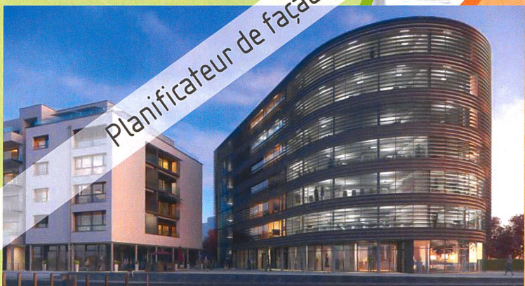
Bâtiment -D- La Croisée, Renens