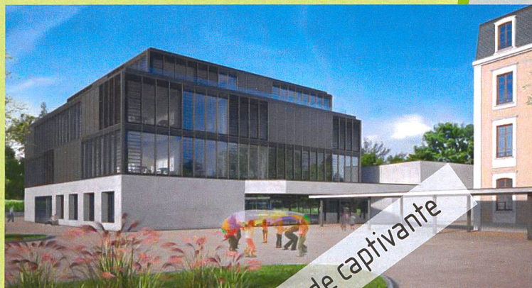
Institut International de Lancy, Étape 3