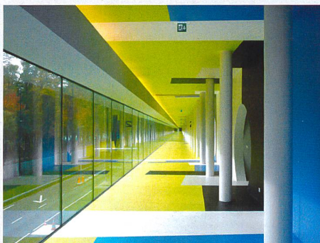
Bâtiment industriel vitré: couloir de l'usine de traitement des ordures