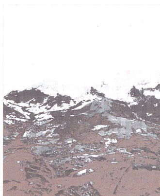
Onze minutes avant Genève, œuvre graphique de Marco De Francesco