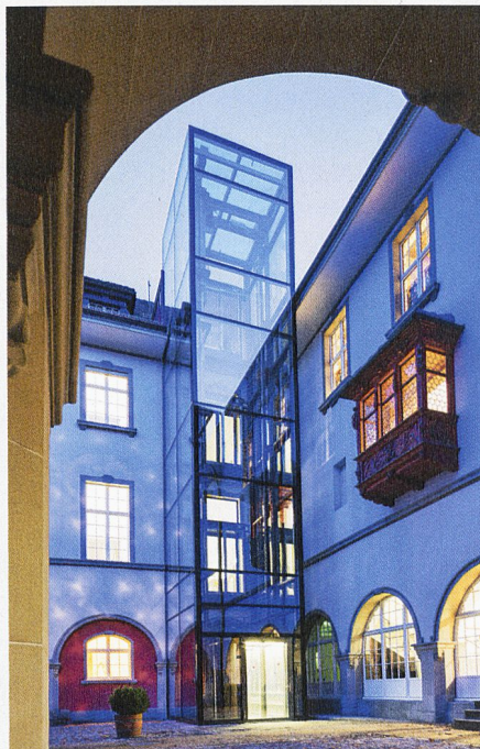
Musée d'histoire et du folklore de Saint Gall: La modernité de la cage d'ascenseur en verre contraste avec le bâtiment historique.

Un certain nombre d'idées originales ont également dû être trouvées pour mettre à jour la desserte d'une résidence en terrasses de plus de vingt ans à St-Moritz. Une solution surprenante a été trouvée: AS