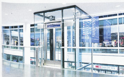
Dans la gare d'Aarau, la transparence des ascenseurs permet une belle visibilité.

Si AS dessert tous les segments de la construction d'ascenseurs avec ses produits standard, ceux-ci ne permettent pas toujours de satisfaire tous les besoins individuels, comme le démontrent les exemples ci-dessus. Que ce soit à St-Gall, à Aarau, à St-Moritz ou n'importe où ailleurs en Suisse, les ingénieurs et techniciens d'AS apportent la preuve que l'entreprise dispose des compétences requises pour fournir les installations spéciales adaptées à chaque situation, dût-elle être hors normes, et développer la bonne solution.