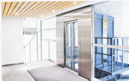
Residenza Laret à Saint-Moritz: Tout aussi convaincant sur le plan esthétique: façades en verre et acier chromé.