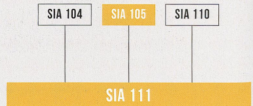
■ Norme (SIA 111) et règlements révisés

(architectes, ingénieurs et autres spécialistes) sur tout le déroulement des études et de la réalisation de l'ouvrage envisagé. Au contraire de la première, la norme SIA 111 Modèle - Planification et conseil structure les interventions liées à des projets ne portant pas sur une construction. Ses champs d'application incluent par exemple le développement territorial, la mobilité et la logistique, les ressources naturelles et celles produites par l'homme.