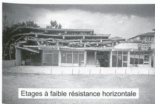
Etages à faible résistance horizontale