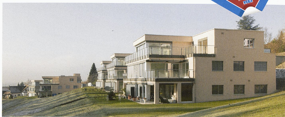
Chaque jour, 600 à 700 avions décollent et atterrissent à l'aéroport de Zurich: Des fenêtres à triple vitrage en profilés VEKA du système SOFTLINE 70 MD ainsi que les portes levantes coulissantes compatibles du système VEKASLIDE 70 instaurent un confort d'habitation.