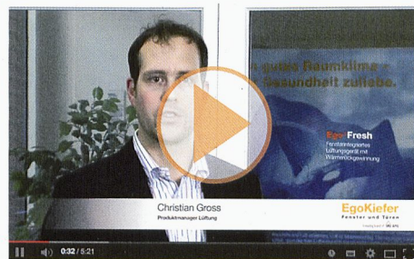
Ego®Fresh, le système d'aération multiloaux compatible avec MINERGIE®

MINERGIE® EgoKiefer est partenaire LEADING PARTNER principal de MINERGIE®