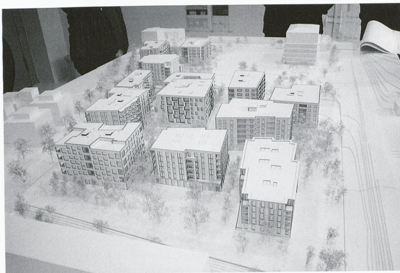
1 Vue générale du projet en maquette

Les candidats avaient à établir le plan d'ensemble du projet et proposer un mode d'habiter. Le terrain attribué par la Ville, initialement dévolu à l'extension d'une usine d'incinération des déchets, est situé en limite nord de Zurich, à l'extrémité d'un vaste territoire en voie d'urbanisation. Bordé par une voie ferrée, il s'ouvre vers la