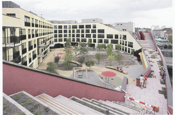
Vue du projet Kalkbreite, réalisé en 2014 à Zurich